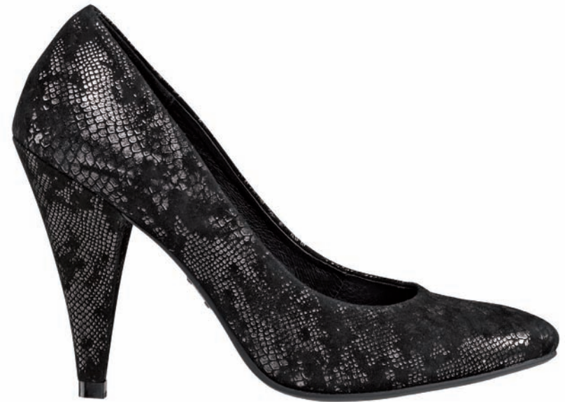
ARTIKEL-NR.: 655 884 03 PREIS: 89,95 EURO FARBE: SCHWARZ MARKE: SEX AND THE CITY® MATERIAL: VELOURSLEDER GRÖSSE: 36 – 41