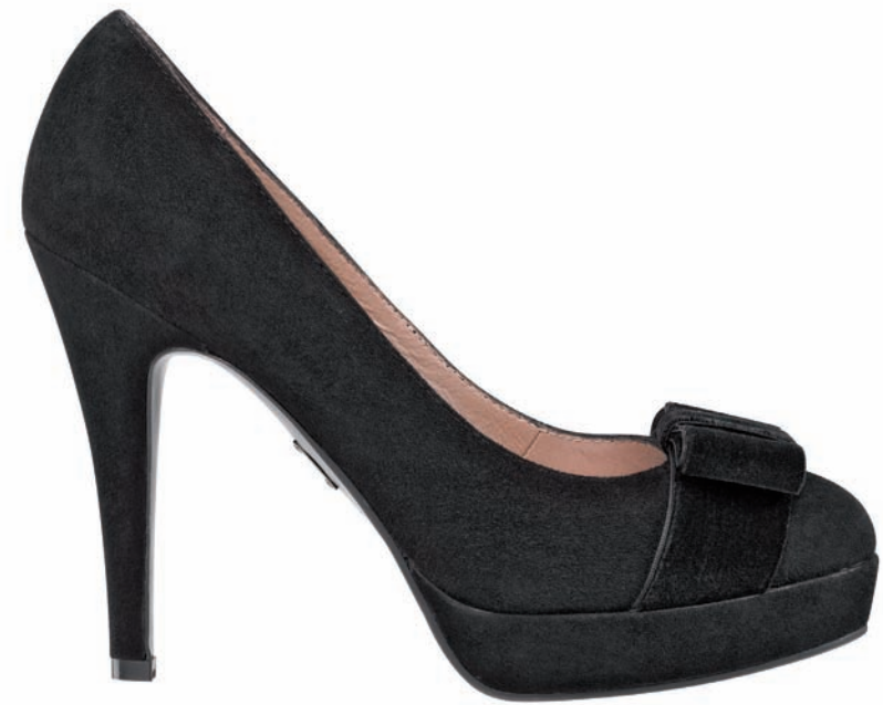
ARTIKEL-NR.: 655 882 01 PREIS: 89,95 EURO FARBE: SCHWARZ MARKE: SEX AND THE CITY® MATERIAL: VELOURSLEDER GRÖSSE: 36 – 41