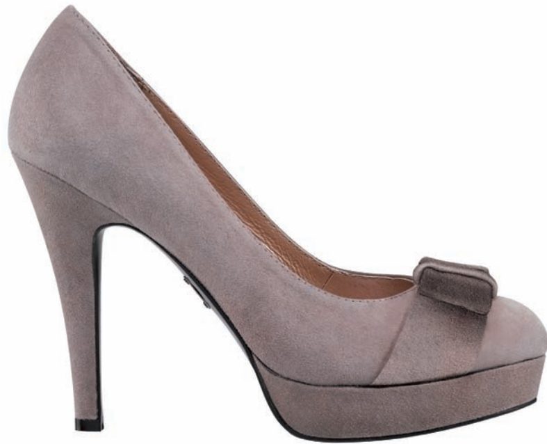
ARTIKEL-NR.: 655 882 02 PREIS: 89,95 EURO FARBE: NUDE MARKE: SEX AND THE CITY® MATERIAL: VELOURSLEDER GRÖSSE: 36 – 41