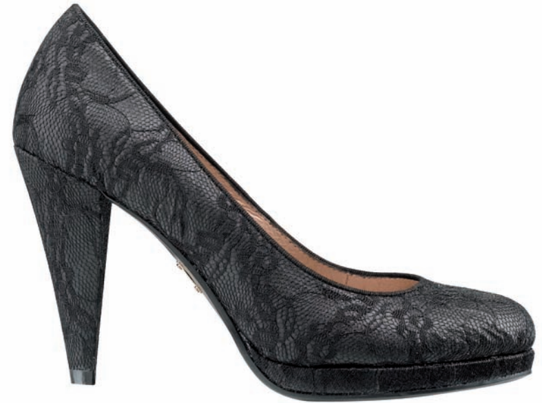
ARTIKEL-NR.: 639 524 01 PREIS: 69,95 EURO FARBE: SCHWARZ MARKE: SEX AND THE CITY® MATERIAL: SATIN GRÖSSE: 36 – 41