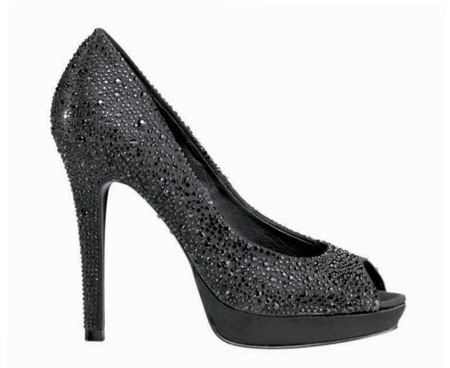
ARTIKEL-NR.: 643 763 01 PREIS: 99,95 EURO FARBE: SCHWARZ MARKE: SEX AND THE CITY® MATERIAL: SATIN GRÖSSE: 36 – 41