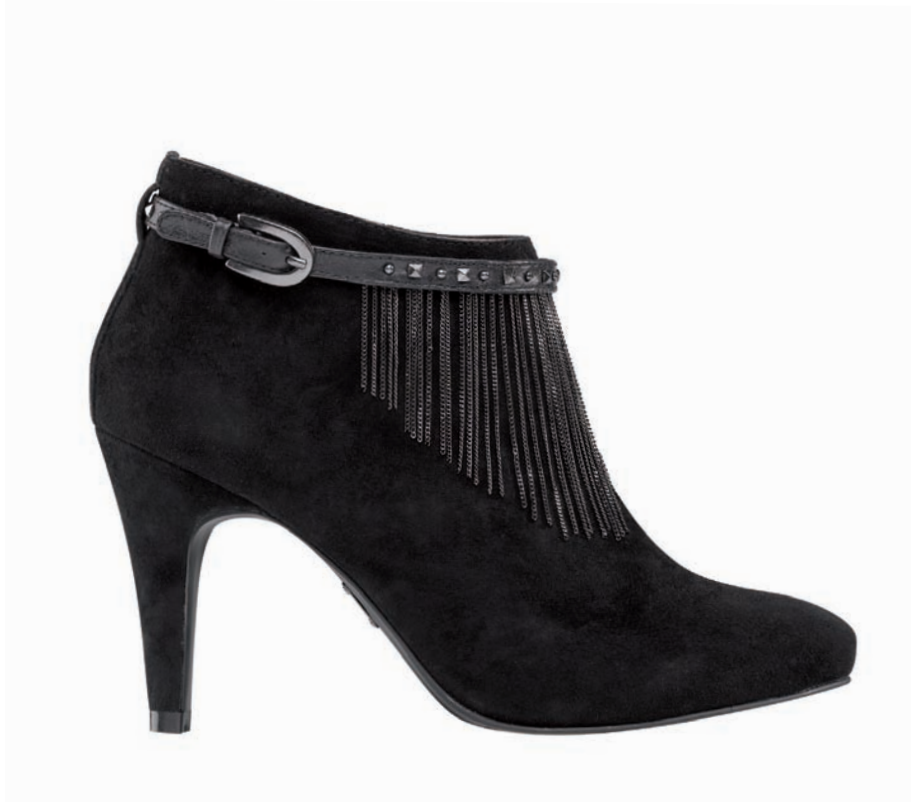
ARTIKEL-NR.: 655 887 01 PREIS: 130,00 EURO FARBE: SCHWARZ MARKE: SEX AND THE CITY® MATERIAL: VELOURSLEDER GRÖSSE: 36 – 41