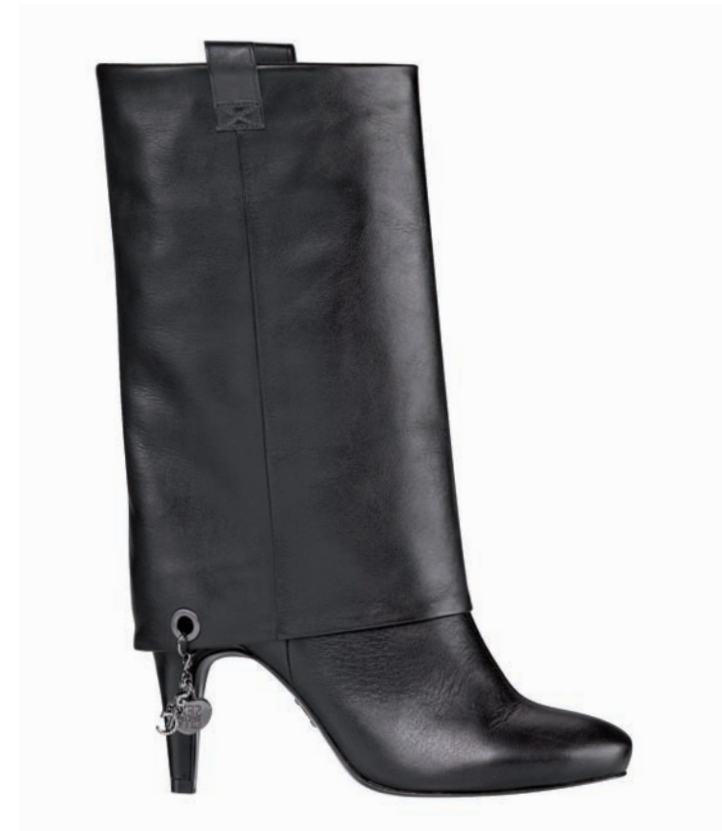
ARTIKEL-NR.: 655 886 01 PREIS: 150,00 EURO FARBE: SCHWARZ MARKE: SEX AND THE CITY® MATERIAL: NAPPALEDER GRÖSSE: 36 – 41