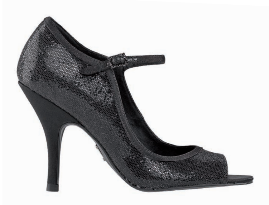
ARTIKEL-NR.: 639 489 01 PREIS: 69,95 EURO FARBE: SCHWARZ MARKE: SEX AND THE CITY® MATERIAL: SATIN GRÖSSE: 36 – 41