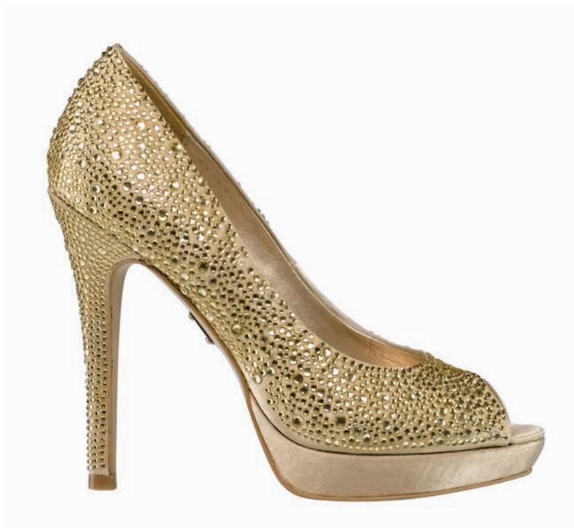
ARTIKEL-NR.: 643 763 02 PREIS: 99,95 EURO FARBE: GOLD MARKE: SEX AND THE CITY® MATERIAL: SATIN GRÖSSE: 36 – 41