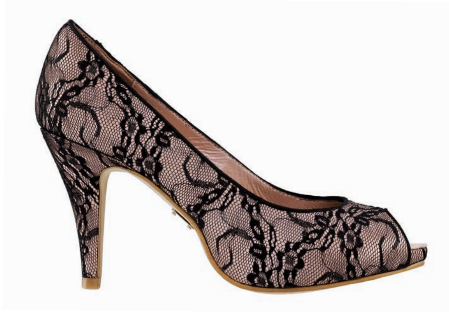
ARTIKEL-NR.: 639 372 01 PREIS: 69,95 EURO FARBE: ROSÉ MARKE: SEX AND THE CITY® MATERIAL: SATIN GRÖSSE: 36 – 41