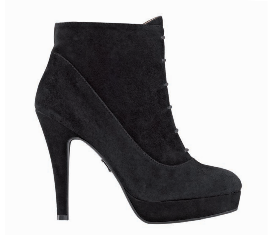
ARTIKEL-NR.: 638 955 01 PREIS: 120,00 EURO FARBE: SCHWARZ MARKE: SEX AND THE CITY® MATERIAL: VELOURSLEDER GRÖSSE: 36 – 41