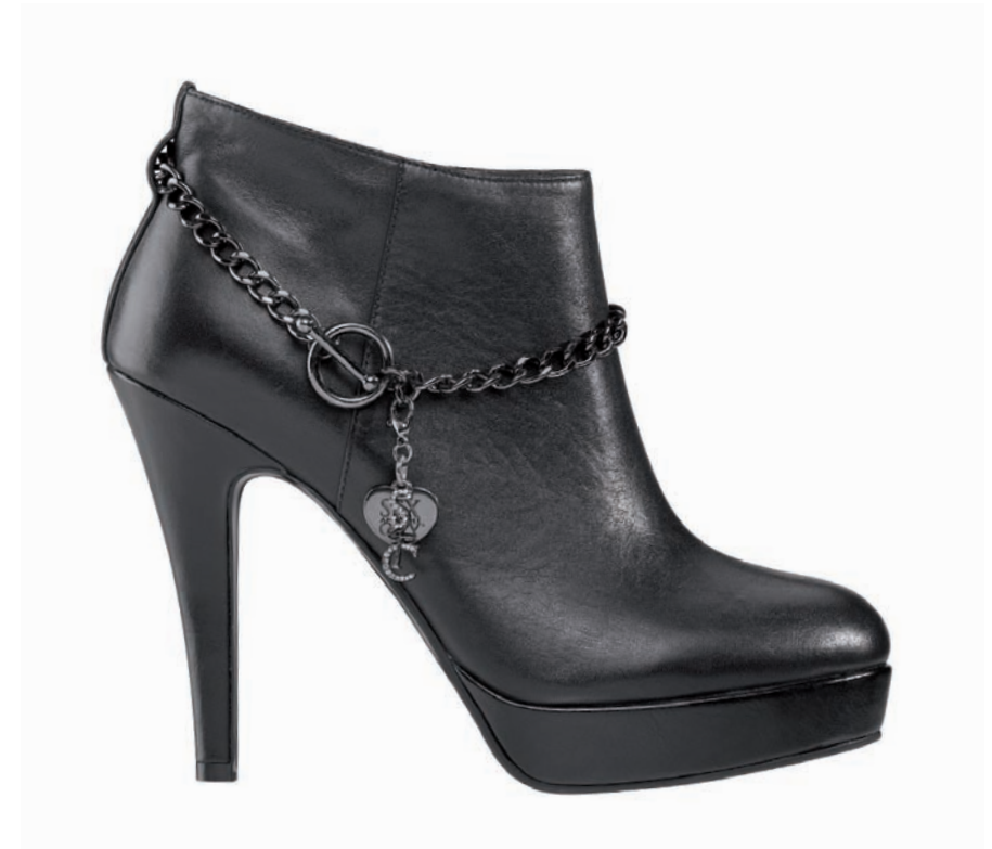
ARTIKEL-NR.: 655 877 02 PREIS: 130,00 EURO FARBE: SCHWARZ MARKE: SEX AND THE CITY® MATERIAL: NAPPALEDER GRÖSSE: 36 – 41