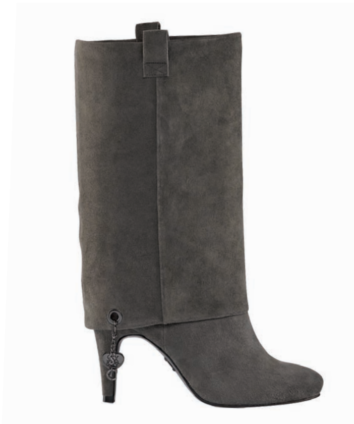
ARTIKEL-NR.: 655 886 02 PREIS: 150,00 EURO FARBE: GRAU MARKE: SEX AND THE CITY® MATERIAL: VELOURSLEDER GRÖSSE: 36 – 41