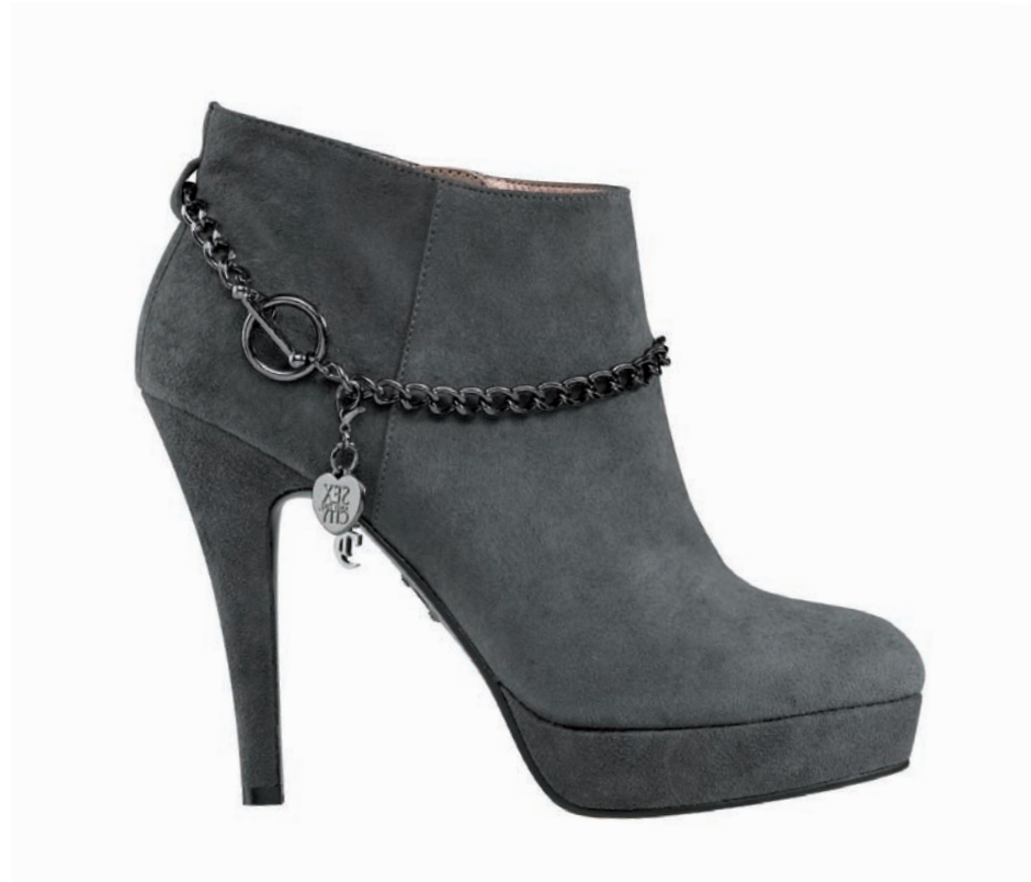
ARTIKEL-NR.: 655 877 01 PREIS: 130,00 EURO FARBE: GRAU MARKE: SEX AND THE CITY® MATERIAL: VELOURSLEDER GRÖSSE: 36 – 41