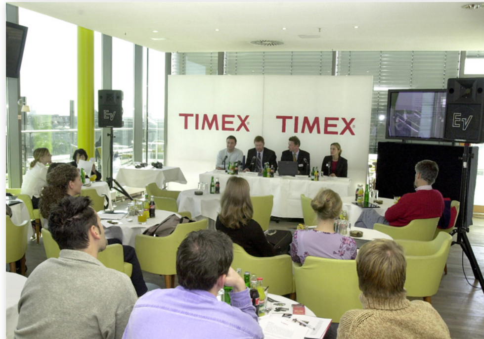
Auftakt-Pressekonferenz auf der Dach-Arena und im Restaurantbereich von Sport Karstadt in Hamburg 24.09.2002